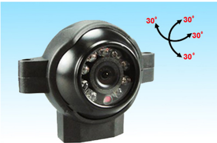
RC-5018 Side View Camera