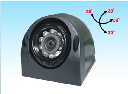
RC-5019 Side View Camera